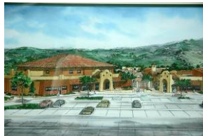
La Nueva Escuela Secundaria Los Coches Creek