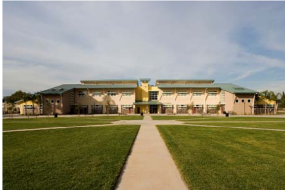
Adición nueva del edificio de dos pisos para salones de clases Cajon Valley Middle