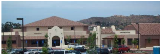
La Nueva Escuela Secundaria Los Coches Creek

Los estudiantes de los grados 6 a 8 de las áreas de las escuelas primarias Blossom Valley, Crest y Rios asistirán a la escuela secundaria nueva. La escuela también estará abierta para transferencias de estudiantes. Para más información, los padres pueden llamar a Charles Roach, Director, al (619) 938-8600. Una ceremonia para la dedicación de la escuela se llevará a cabo a finales del año.