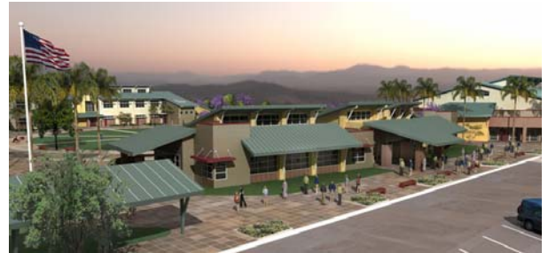
Cajon Valley Middle School

La fase final del proyecto de mejora para el campo escolar de Cajon Valley Middle School está en proceso. Se espera que sea finalizada para enero del 2008.