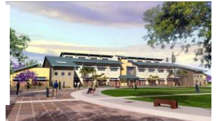
Cajon Valley Middle