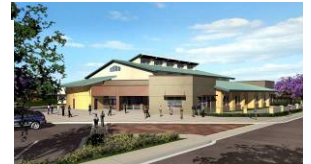
Cajon Valley Middle